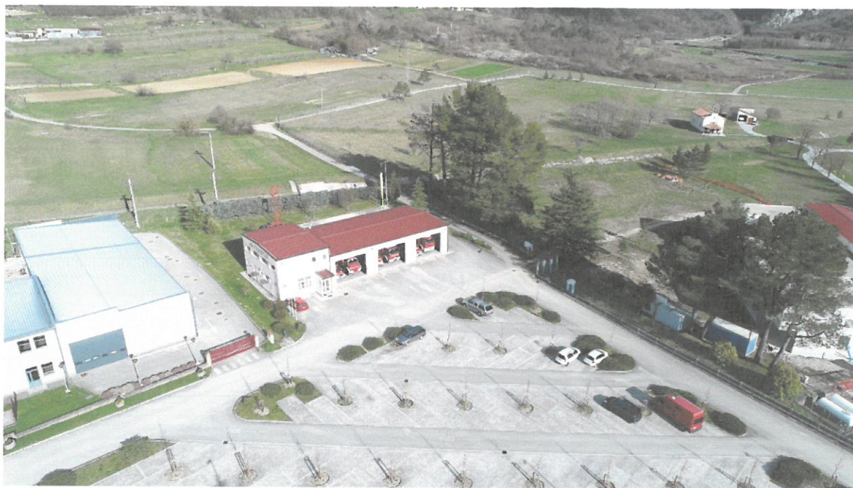
Javna vatrogasna postrojba Buzet slikano dronom

Zahvaljujući Gradu Buzetu i Područnoj vatrogasnoj zajednici Buzet danas imamo dobro opremljenu i operativnu vatrogasnu postrojbju sa kvalitetnim voznim parkom u kojoj je zaposleno 19 djelatnika od čega 17 profesionalnih vatrogasaca raspoređenih u 4 smijene. U svakoj smijeni su 4 vatrogasca a zapovjednik radi u dnevnoj smijeni.