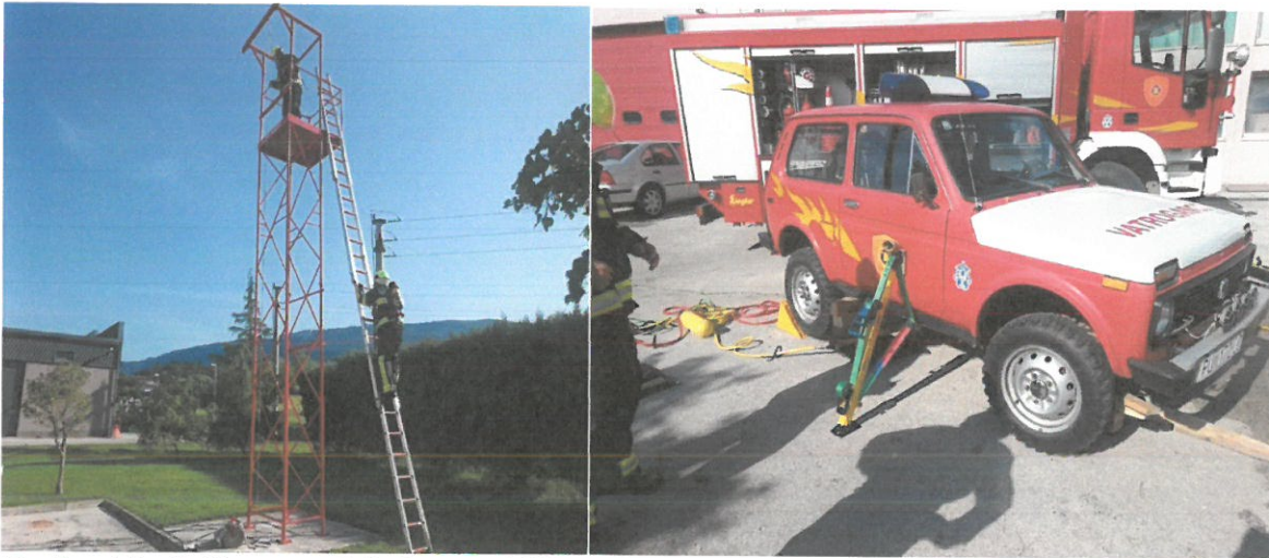
Radovi i vježbe na visini te stabilizacija vozila