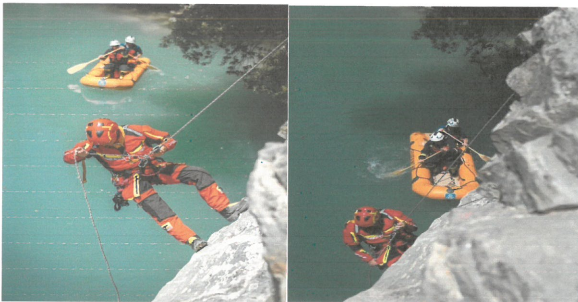
Spašavanje iz visina i dubina te radovi na vodi

U sklopu redovnog programa nastave i vatrogasnih vježbi u Javnoj vatrogasnoj postrojbi Buzet provode se vatrogasne vježbe odnosno obuka radova na visini, radovi na vodi, stabilizacija vozila na tehničkim intervencijama i ostale teme po godišnjem programu.