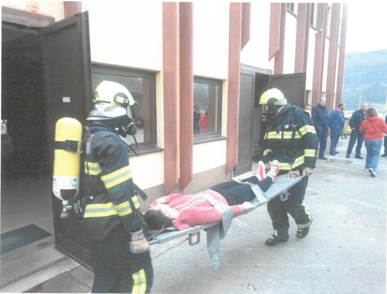
HEP Buzet – vježba evakuacije

Na području našeg djelovanja odnosno području Grada Buzeta i Općine Lanišće, Javna vatrogasna postrojba Buzet periodično izvodi taktičko operativne vježbe sukladno Procjeni ugroženosti od požara i planu evakuacije po firmama i ustanovama (Cimos, HEP, Srednja škola, Osnovna škola, Dom za starije, dječji vrtić, Vodovod Buzet i Butoniga).